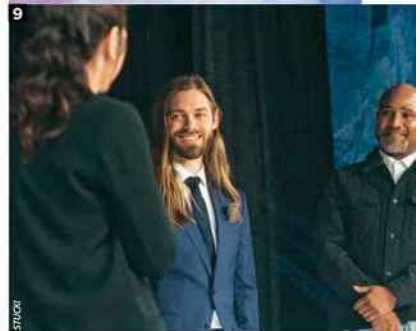
6. L'actrice Thandie Newton. 7. L'acteur Eric Judor. 8. L'immense gâteau d'anniversaire. 9. Les acteurs stars de The Walking Dead Tom Payne et Seth Gilliam (à dr.)