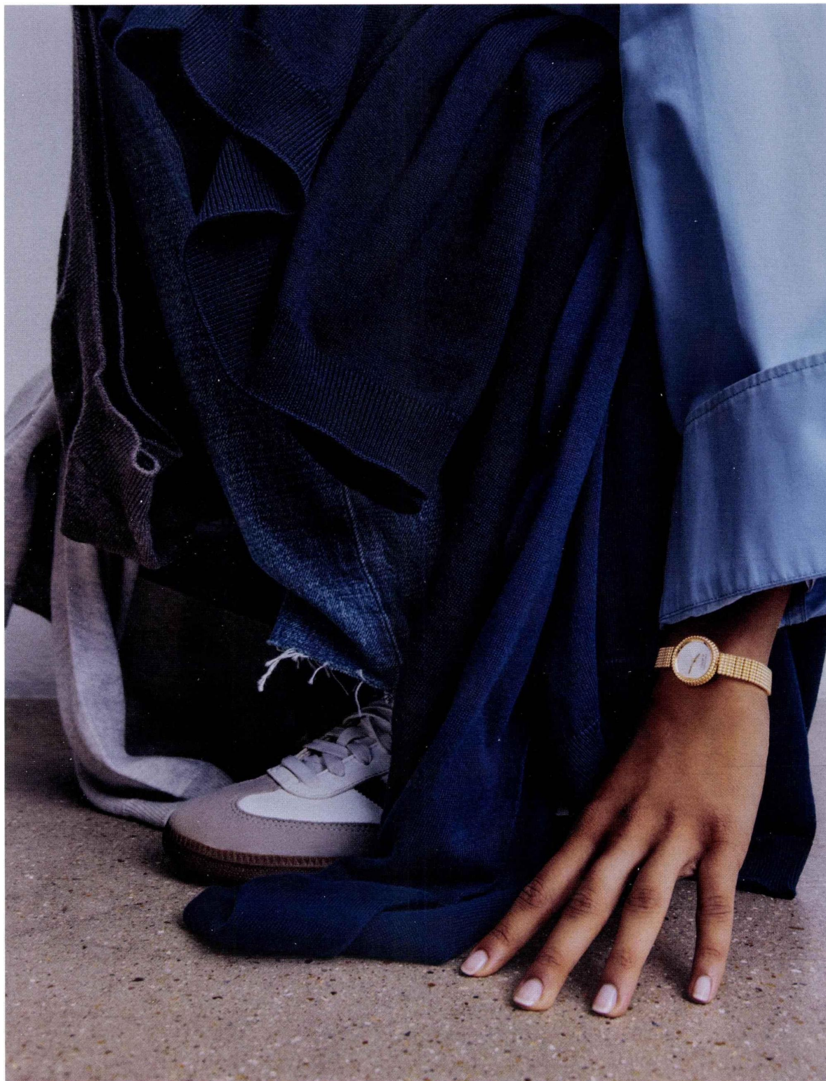
Montre Perlée en or rose, mouvement à quartz, Van Cleef & Arpels. Chemise Valentino, pulls noués à la taille Babaa, pantalon Celine par Hedi Slimane, baskets Adidas. Page opposée : montre Golden Ellipse en or blanc, mouvement mécanique, Patek Philippe vintage ( Collector Square ). Veste à capuche Ferragamo, culotte personnelle.