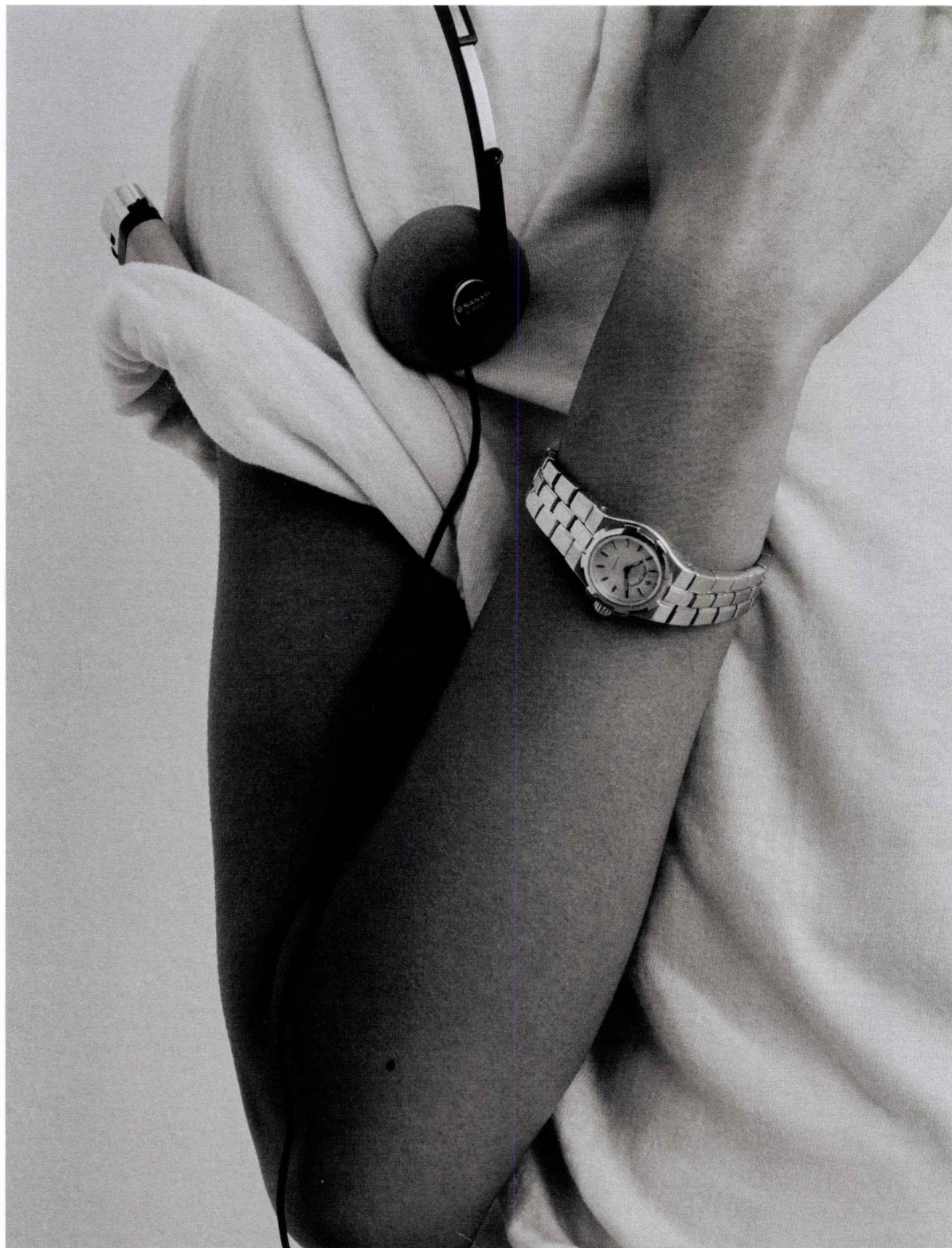
Montre Overseas en or jaune, mouvement à quartz, Vacheron Constantin vintage (Collector Square). T-shirt vintage (Le Vif boutique). Page opposée : montre Fendigraphy en acier inoxydable doré, mouvement à quartz, Fendi.